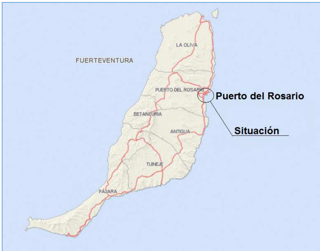
Plano de Fuerteventura.