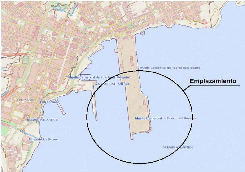
Plano de Puerto del Rosario.