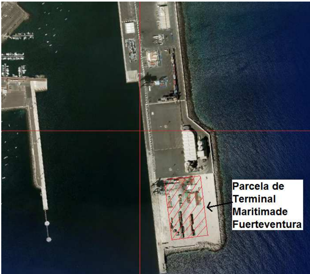
Plano del Puerto del Puerto del Rosario